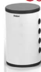
Puffer 100 (100 L)