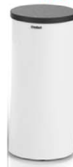
Puffer 200 (200 L)